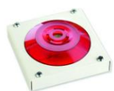
МАЯК-220-КПМ1-НИ оповещатель комбинированный, металлический корпус, наружное исполнение